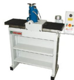
Soffietti di protezione Rubber protection bellows ゴム製保護ペローズ