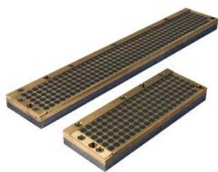
Piano magnetico a campo aperto per metallo duro Open field high power magnetic chuck for carbide inserts 超硬チップ用オープンフィールド高出力マグネットチャック

The BM 400 grinding and lapping machine is a professional solution for grinding and lapping carbide (HM) shaped inserts, and features a fixed mechanical aluminum work-surface on which a special open field magnetic chuck is fixed.