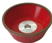
Mola diamantata Diamond grinding wheel ダイヤモンド砥石

BM 400 研削およびラッピング盤は、超硬 (HM) 形状のインサートの研削およびラッピングのためのプロフェッショナルなソリューションであり、特殊なオープンフィールド磁気チャックが固定された固定機械アルミニウム作業面を備えています。